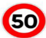
Type B 14

Pour rappel : Ces panneaux sont de prescription obligatoire, avertissant l'automobiliste de la vitesse maximale autorisée sur le tronçon de la route. Le panneau type B30 est employé pour annoncer une zone où la vitesse est limitée à 30 km/h, zone définie par les articles R.110-2 et R411-4 du Code de la route.