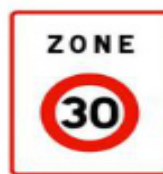
Type B 30